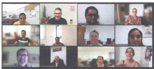
Reunión de trabajo con la Coordinación de Prerrogativas, Igualdad y Sistemas, acerca del Sistema Conóceles