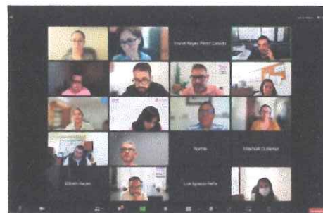
Reunión de trabajo sobre la Memoria Institucional Participan Consejerías del Comité Editorial y Titulares de las Áreas