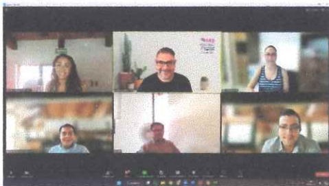
Reunión de trabajo con Asesores de las Consejerías, para analizar proyectos de resolución de clasificación de información