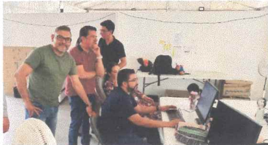
Capacitación por parte de CTAI a personal del Instituto sobre elaboración de versiones públicas