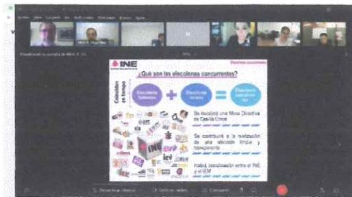
Capacitación por parte del INE para el apoyo en la jornada electoral del 2 de junio