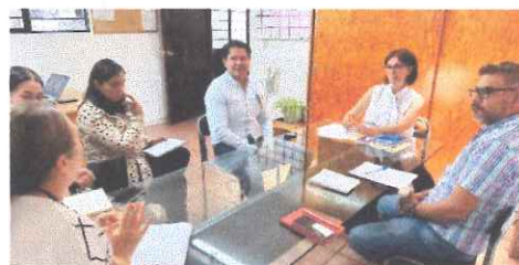
Reunión de trabajo con la Secretaría Ejecutiva y la Coordinación de Igualdad, para elaboración de las versiones públicas en atención a una solicitud de información